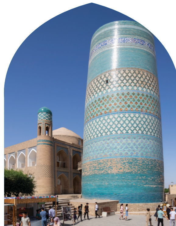
Хива 15.30-17.00 (Тошкент вақти) (гибрид форматда)

16:30 - 17.00 Экспертларнинг қисқа шарҳлари. Муҳокама учун мавзулар: -Профессонал тажриба билан танишув; - Халқаро маслаҳат қўмитаси доирасида ҳамкорлик қилиш имкониятлари; - Ўзбекистонда Умумжаҳон мероси объектларини сақлаш ва файта тиклаш нуқтаи-назаридан муаммо ва имкониятлар; - Халқаро маслаҳат қўмитаси асосий тадбирлари ва амалий натижалари