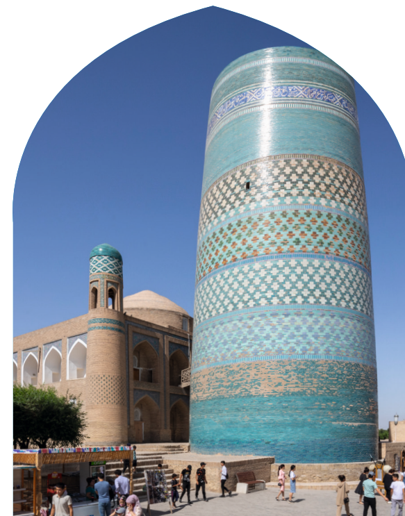
Хива 15.30-17.00 (Ташкентское время) (гибридный формат)